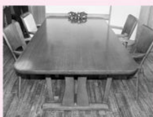
高齢者の背丈にあった高さのテーブルを使用