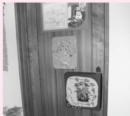
ノブを飾りなどで隠す