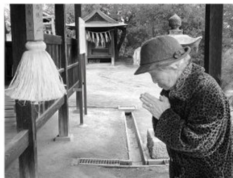
近くの神社への参拝