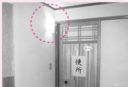
夜間に灯りをつけておくとトイレに行きやすい