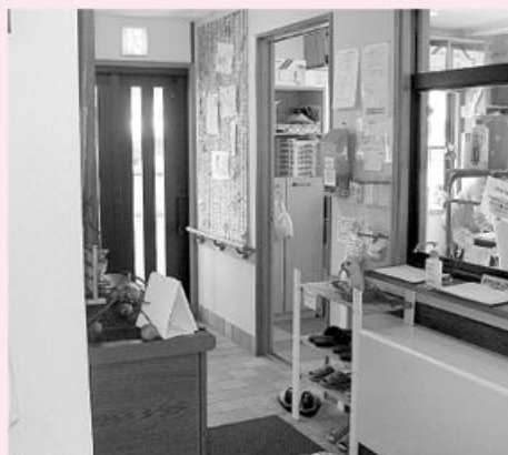
直接見えないところへ設置してある玄関