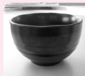
テーブルが高すぎると中が見えにくい