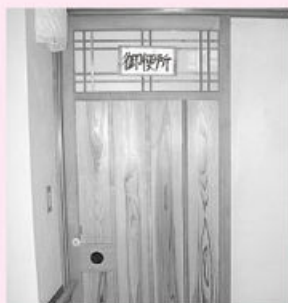
トイレらしい戸の設置