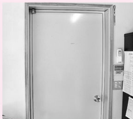
ドアと壁の色を同じ色彩で