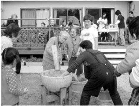
石臼でのもちつき