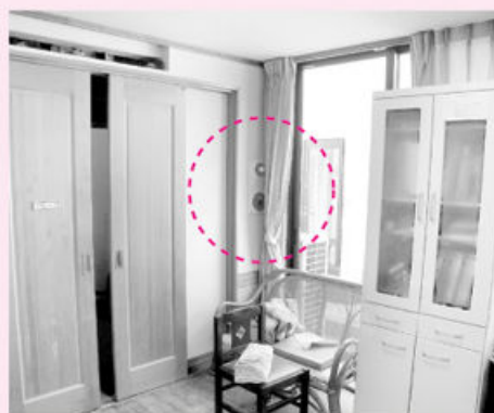
分かりにくくする