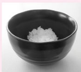
テーブルが丁度良い高さだと中が見やすい