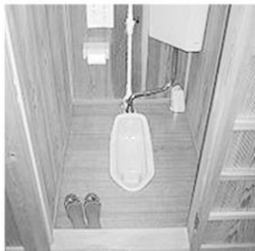
昔ながらのトイレ